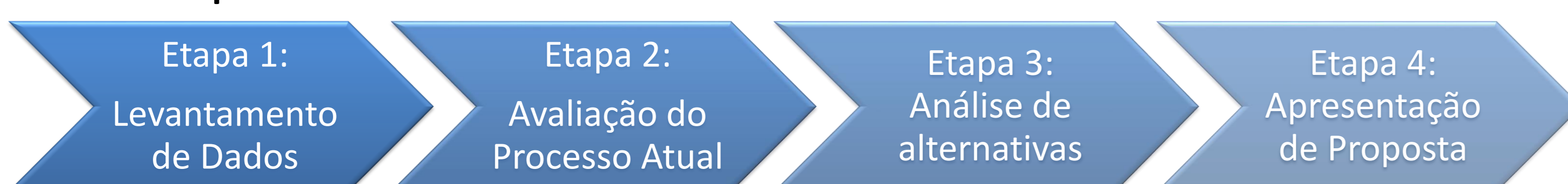
Figura 1 – Fluxograma da metodologia

Esta pesquisa tem abordagem combinada quantitativa-qualitativa, através de pesquisa exploratória com aplicação em uma empresa, pois foram coletados dados reais de materiais utilizados na produção. Como critério de quais informações buscar, após estudo dos processos relacionados, foram considerados principalmente os dados que tangem a política de estoque. Desta forma, há os números necessários para que a análise seja feita e o objetivo do trabalho, que é propor um procedimento para gestão de política de estoques, seja atingido. O fluxograma apresentado na Figura 1 simplifica a compreensão da metodologia orientada neste trabalho, com suas etapas.