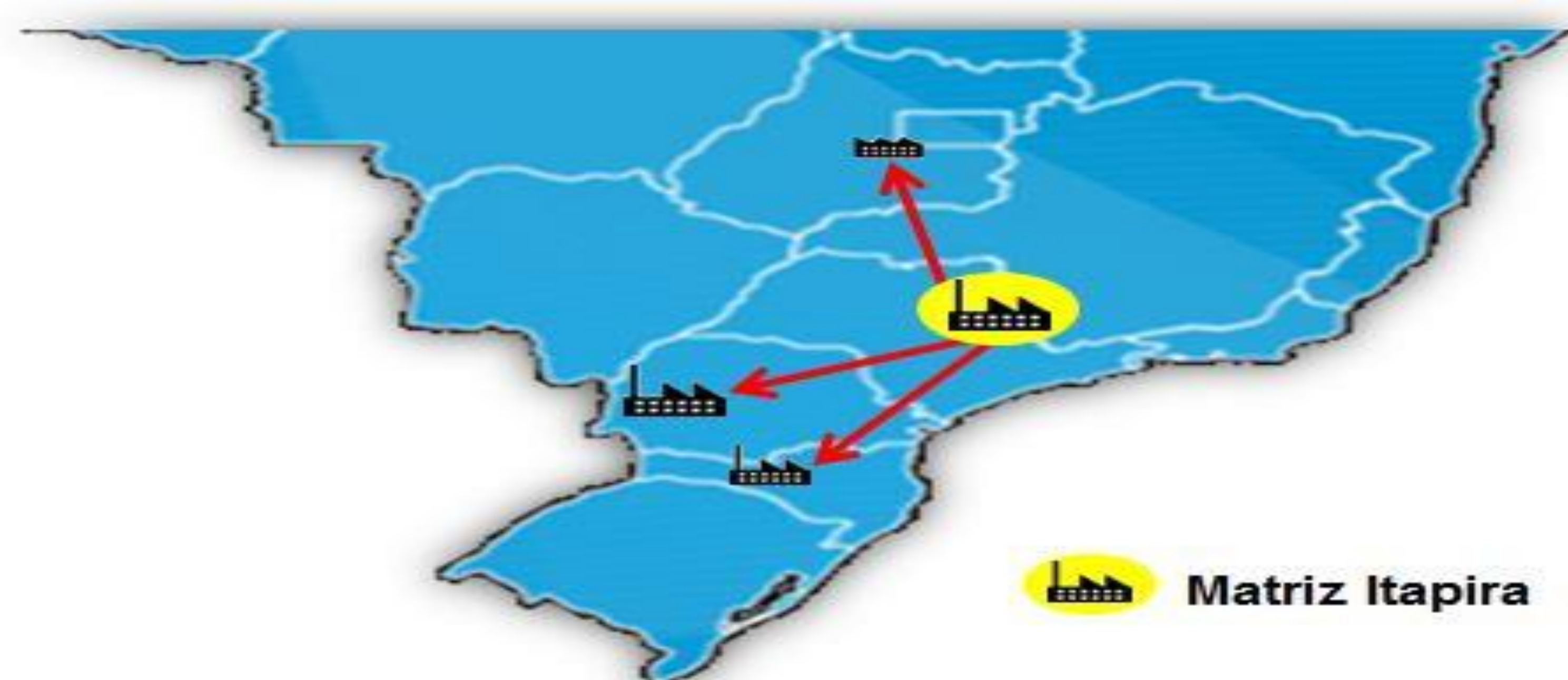
Figura 1 - Representação da matriz como warehouse central

Centralização e armazenagem dos materiais coletados no estado de SP na matriz, dessa a forma a matriz trabalhará como um warehouse central.