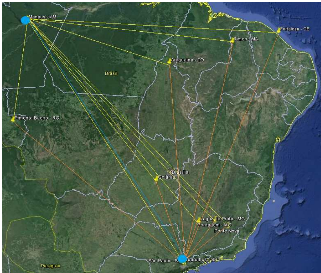
Figura 3: Modelo de distribuição na situação atual

A empresa trabalha atualmente com dois modelos de transporte, onde a responsabilidade pelos custos de transporte é definida pela categoria, podem ser CIF (Transporte e seguro por conta do Fornecedor) ou FOB (Transporte e seguro por conta do Cliente).