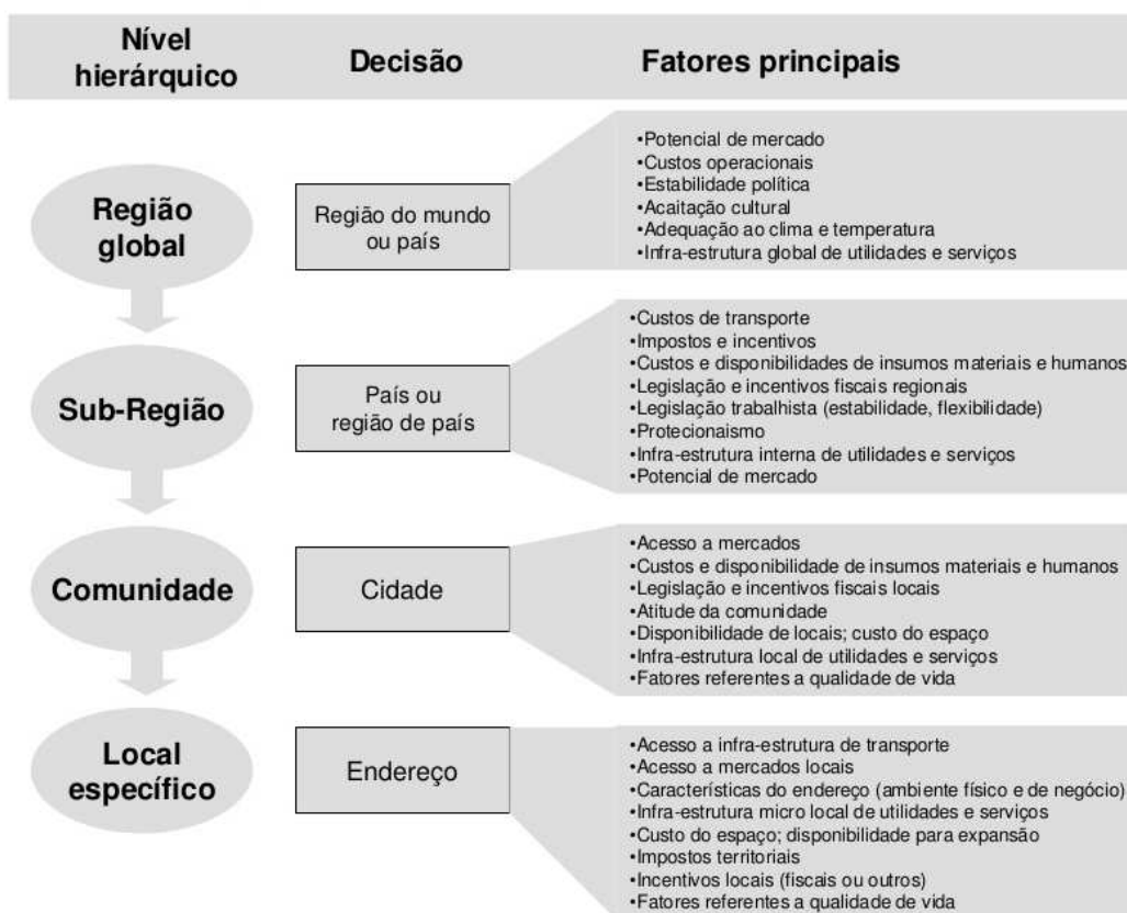
Figura 1: Hierarquia das decisões de localização (Fonte: Adaptado de Corrêa e Corrêa, 2006).

A localização de uma operação logística afeta não somente o custo de transporte ao longo dos canais de distribuição, o custo de mão de obra, o custo e disponibilidade de energia, água, infra-estrutura de telecomunicações, tecnologia de informação e outros, mas também a capacidade de a empresa competir no mercado. Decisões erradas de localização custam caro para a empresa e são normalmente difíceis e caras de serem revertidas. Decisões de localização, portanto, devem sempre ser cuidadosas e periodicamente avaliadas. Deve-se sempre procurar garantir que os principais fatores inter-relacionados estejam sendo levados em conta, como a proximidade dos clientes, das fontes de suprimentos, mão de obra e referente ao ambiente físico e de negócios. (CORRÊA, HENRIQUE, 2010). A figura 1 ilustra um modelo de critérios para decisão de localização: